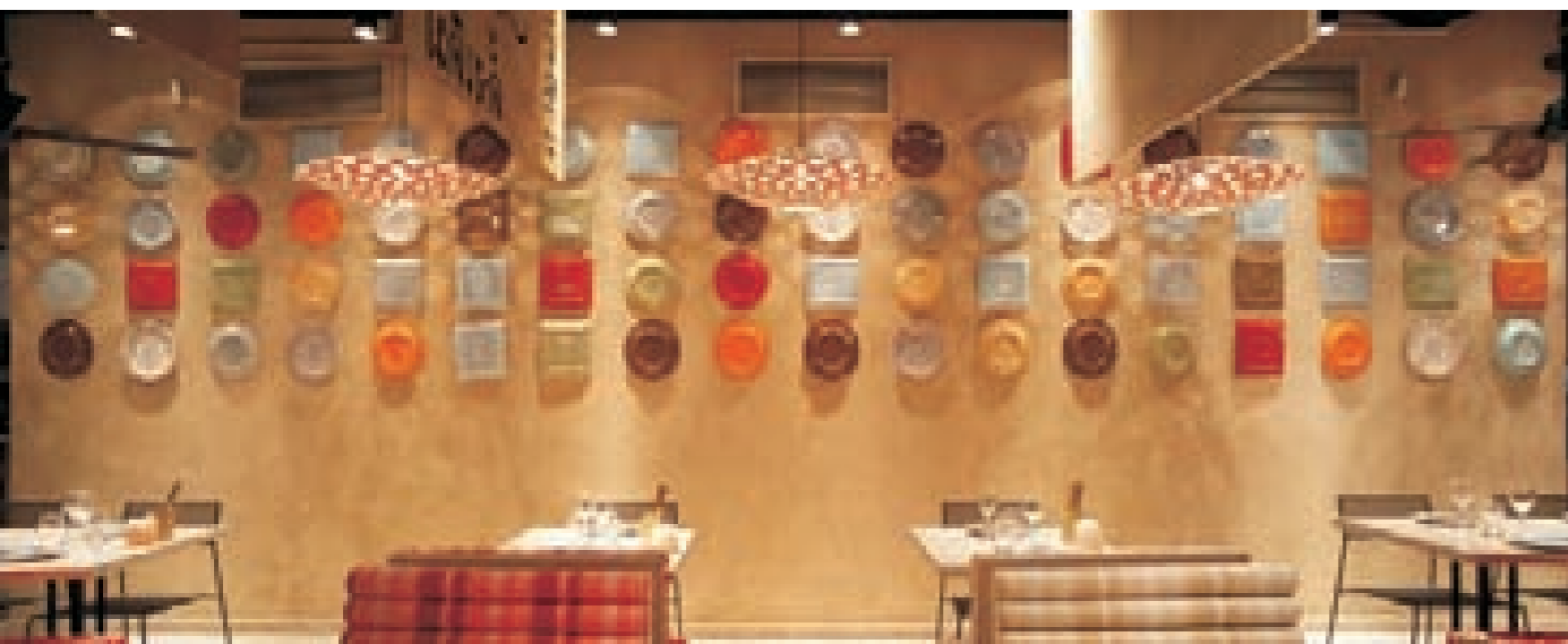
图6 模拟传统泰式枕头形状而制成的彩色长椅